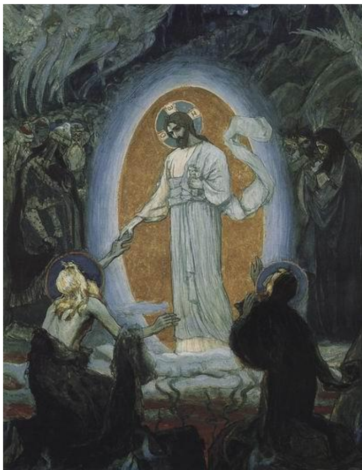
Mikhail Nesterov, Descida aos Infernos, 1895