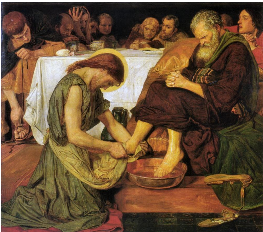
Ford Madox Brown, Jesus lava os pés a Pedro, 1852-6