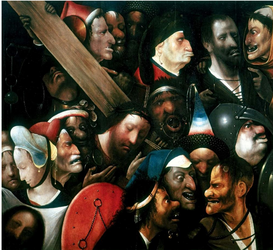
Um discípulo de Bosch, Cristo Carregando a Cruz, séc. XVI

Entregou-lhes então Jesus, para ser crucificado. E eles apoderaram-se de Jesus. Levando a cruz, Jesus saiu para o chamado Lugar do Calvário, que em hebraico se diz Gólgota.